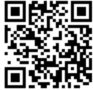
สิ่งที่ส่งมาด้วย ๑ - ๒