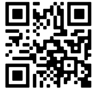
ลงทะเบียนวันที่ ๒๐ เม.ย. ๒๕๖๕